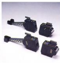
Die Messwertnehmer mit autarker CCD-Messensoren übertragen die Daten zum PC.