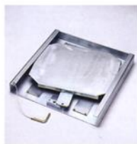
Stabile Schieberunterstützen mit schwenkbar/ schiebbarer oberer Platte zum verspannungs-freien Vermessen/ Einstellen der Hinterräder.